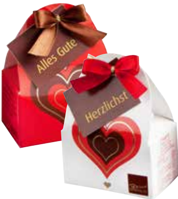
Präsentiäschen mit 2 Nougat-Herzen Little gift bag with 2 nougat-hearts