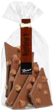
Haselnuss-Bruch/ Edelvollmilch-Schokolade Haselnuss-Bruch/ Zartbitter-Schokolade Break chocolate