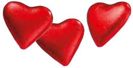
Herzen, verschiedene Größen Hearts, different size