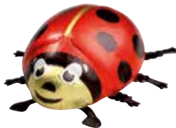
Glückskäfer, versch. Größen Ladybird, different size