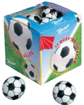
Fußbälle in Würfel Footballs in a cube