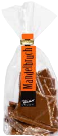
Mandel-Bruch/ Edelvollmilch-Schokolade Mandel-Bruch/ Zartbitter-Schokolade Break Almond