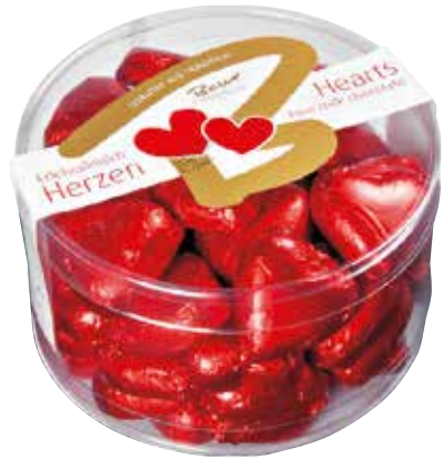
Herzen klein in Mini-Klarsichtdose Hearts small in a mini clear box