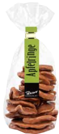
Apfelringe mit Edelvollmilch- Schokoladen-Überzug sowie Zartbitter-Schokoladen-Überzug Apfel fries