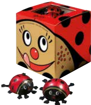
Glückskäferchen in Würfel Ladybirds in a cube