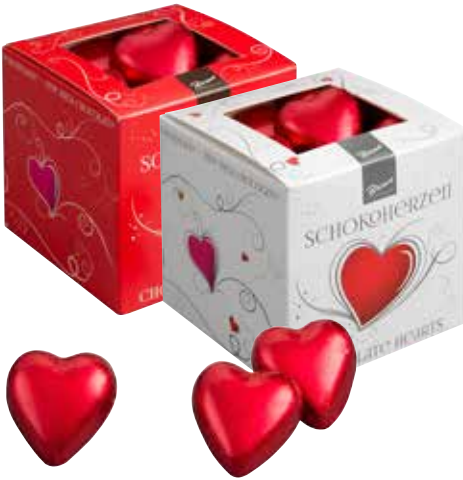
Herzen klein in Würfel Hearts small in a cube