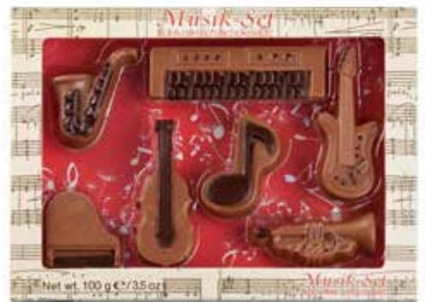
Musikset und andere Sets Music set and other sets