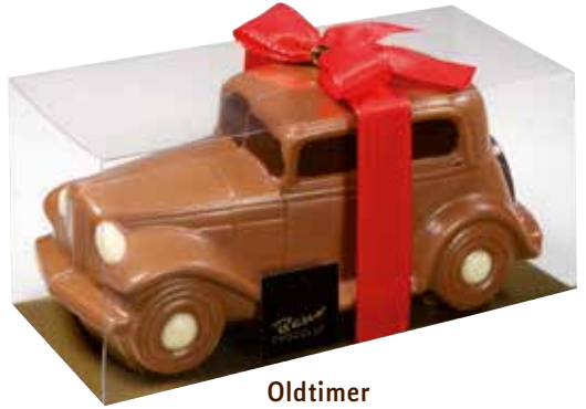
Oldtimer Classic car