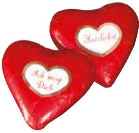
Herzen groß mit Spruchtexten Hearts big with text